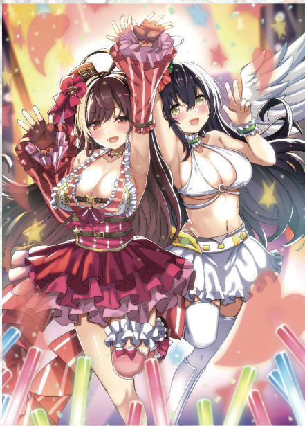
プリズム with ペクティリス Illust:ハル犬 <EXパック サマステージ!! 収録>

「わわわっ。ペクティリスさんに憧れられるなんて滅相もない!? なんまんだぶなんまんだぶありがたえありがたえ」