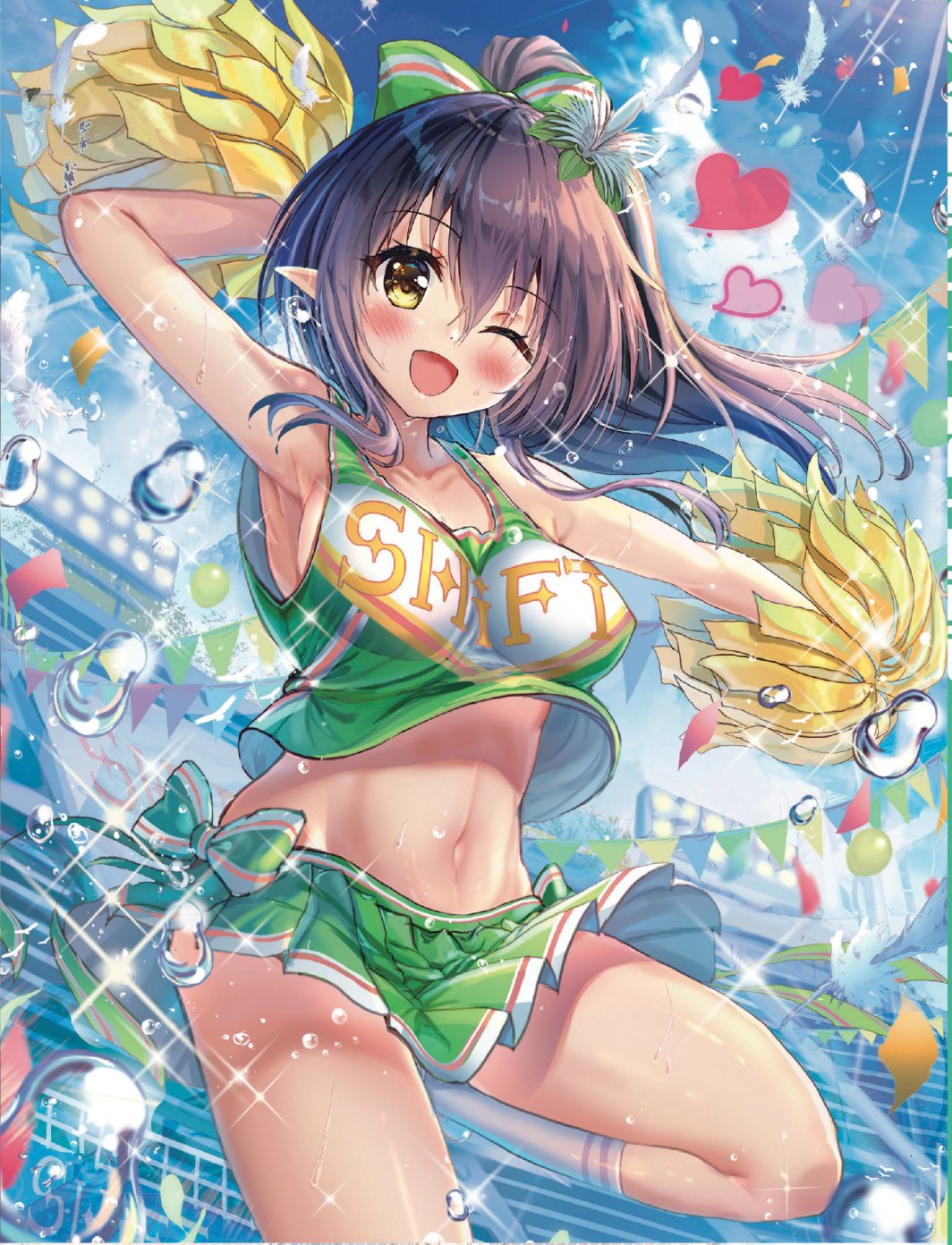
◆ グルーミング・チア!ペクティリス

「精一杯の気持ちを込めて、応援します! いつも皆さんから勇気をもらっていますから!」